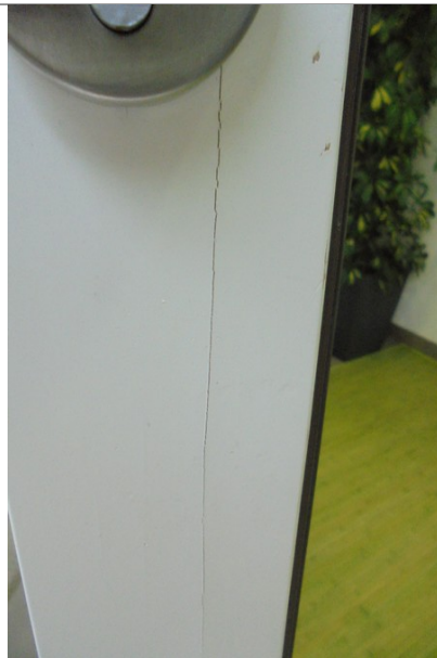
Fisuras verticais en elementos de carpintería