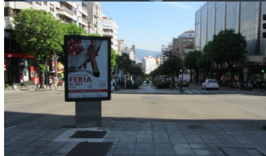
Recorrido Peatonal- Cruce calle María Berdales con Gran Vía Cruces en Gran Vía

Como se puede apreciar en la última foto a veces el boulevard central se queda sin paso peatonal tanto transversal como longitudinal, obligando al peatón a ir marcha atrás para poder cruzar.