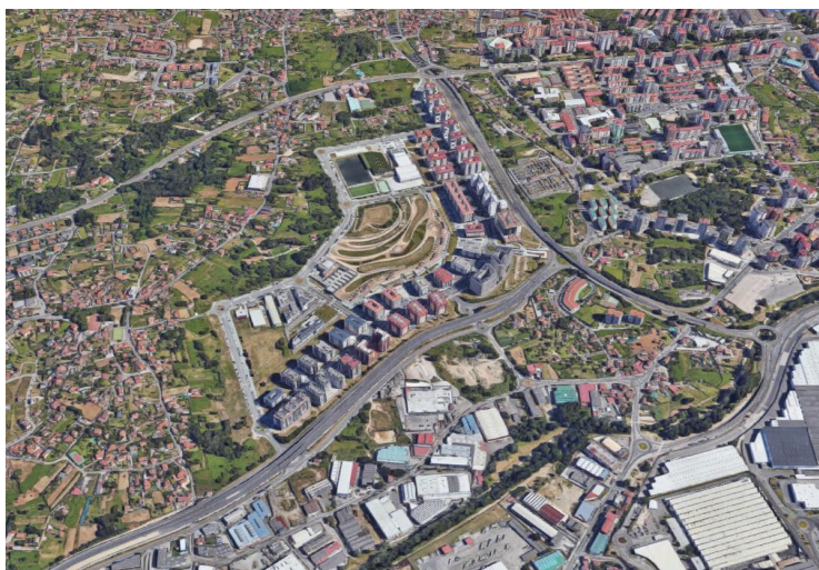
Vista área do ámbito.- fonte proxecto achegado, autoría Proyfe, SL

A modificación puntual propón para as fases pendentes de desenvolvemento urbanístico unha dotación de 22.757 m 2 de zonas verdes, 23.946 m 2 de equipamentos, 1.213 prazas de novos aparcamentos públicos e a plantación de 2.341 árbores, o que cumpre as reservas mínimas establecidas na LSG para todo o sector de solo urbanizable.