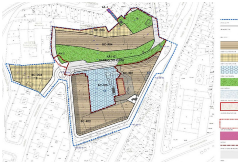
Imaxe 1 Delimitación da Área de Repartición en solo urbano non consolidado AR-1 (en liña descontinua de trazo e punto granate) sobre a ordenación detallada do ámbito da MP-BARRIO DO CURA .

Esta ordenación foi establecida directamente pola Modificación Puntual do PXOU de Vigo de 1993 para a reordenación do Barrio do Cura, en desenvolvemento das determinacións estruturantes establecidas para este ámbito de solo urbano non consolidado na correspondente ficha de planeamento