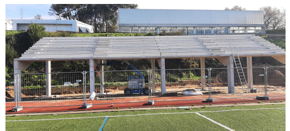
Imaxes do estado da construción da visita do 27/12/2022