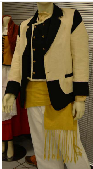
Traxe con pantalón e chaqueta e camisa (de liño). chaleque de pano, e faixa