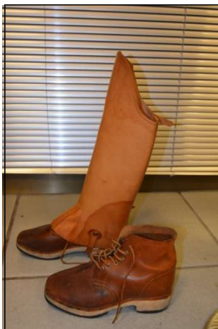
Zocos / Polainas