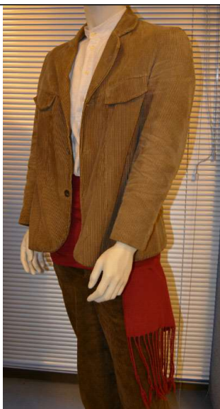
Traxe con pantalón e chaqueta (de pana), camisa (de liño), e faixa