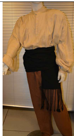
Camisa, pantalón de liño e faixa